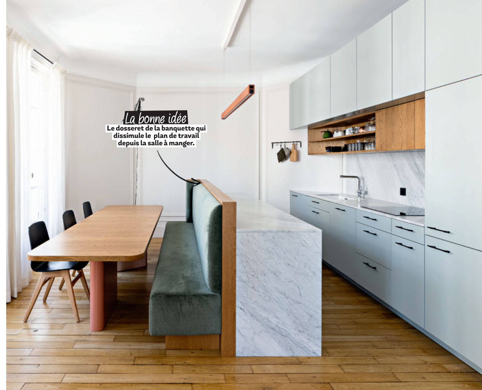
La bonne idée Le dossier de la banquette qui dissimule le plan de travail depuis la salle à manger.