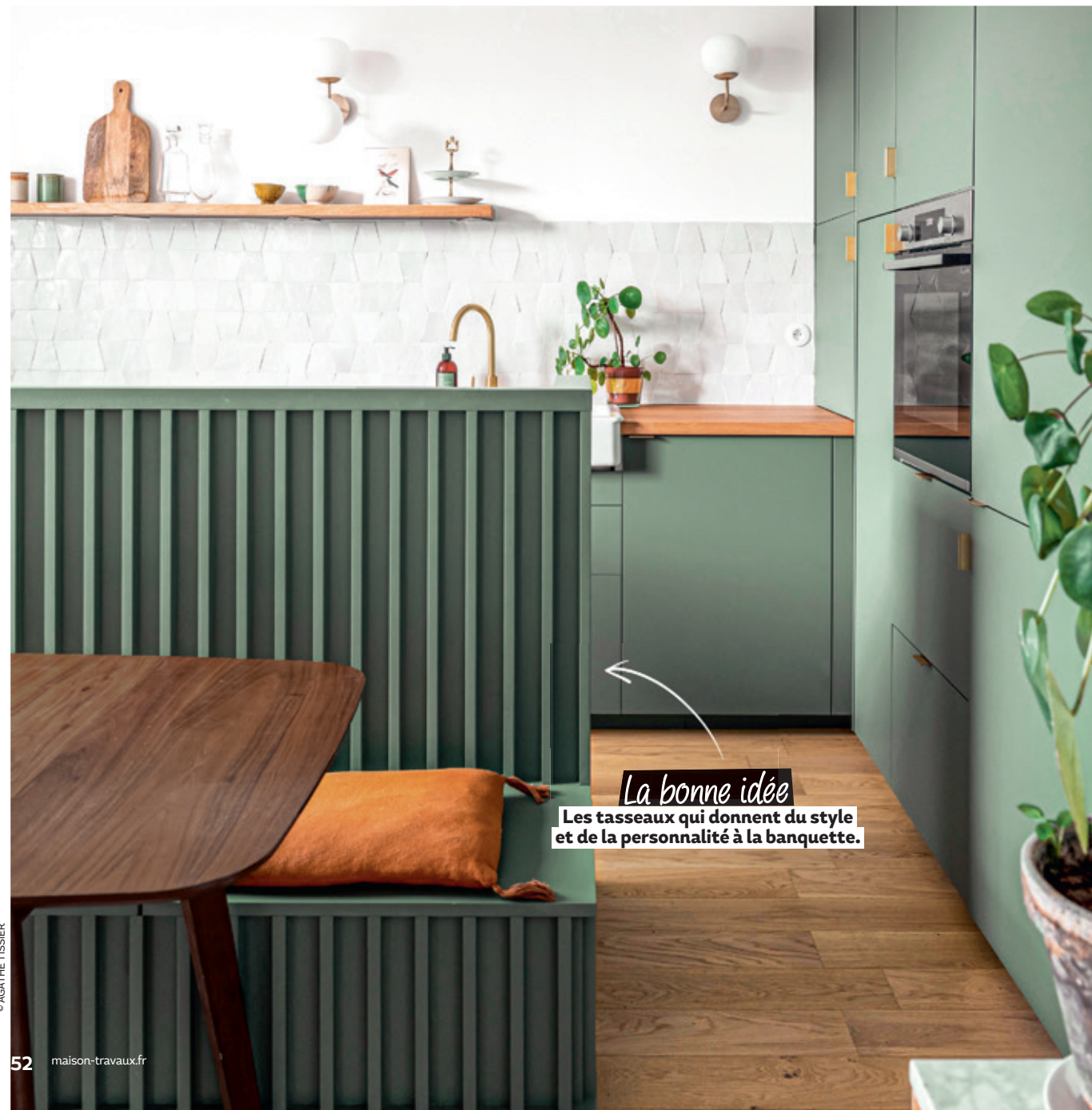
La bonne idée Les tasseaux qui donnent du style et de la personnalité à la banquette.

La présence de la cuisine est atténuée, mais la perspective est conservée sur toute la longueur de la pièce.